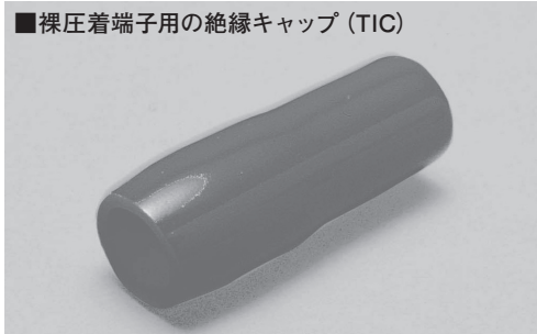
■裸圧着端子用の絶縁キャップ (TIC)